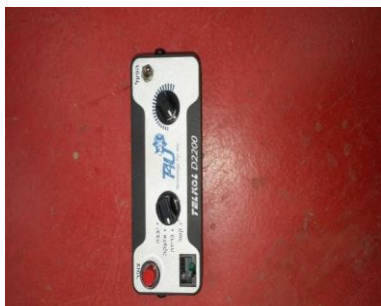
בקרה למגבר צופר ברכב מבצעי