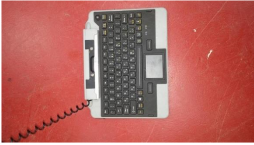
מקלדת לדרך המלך